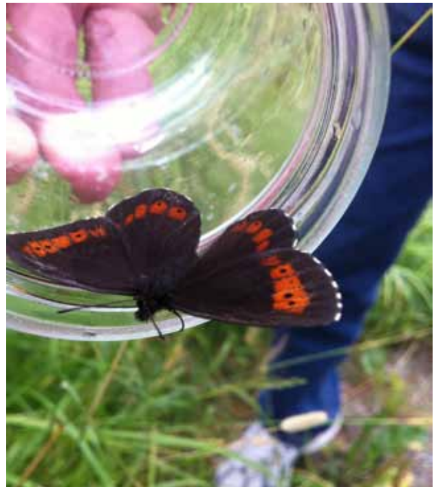
Skogsgräsfjäril, sammetsbrun med orange teckning.

Det finns även särskilda fjärilskikare att köpa om man är intresserad av att se detaljer mer på avstånd. Det speciella med fjärilskikare är att man kan se skarpt även på nära avstånd.