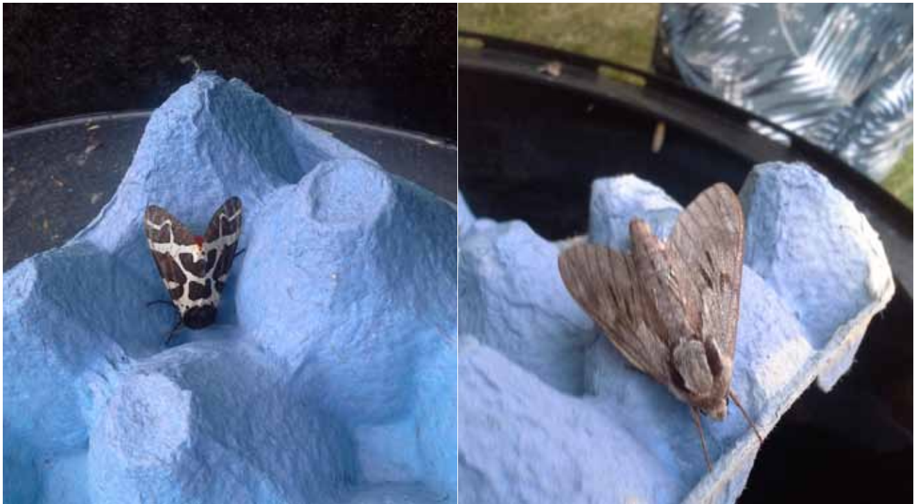
Brun björnsparfjäder och Tallsvärmare, två arter av nattfjärilar.

Många nattfjärilar är bra på att känna lukter. De kan man locka till sig med hjälp av sockrade beten. Man blandar sirap/socker, öl eller gammal frukt. Sen dränker man in tygbitar eller bomull i blandningen, låter stå några dagar och sätter sedan på natten i en tråklyka. Särskilt på vår och höst är luktfällorna populära.