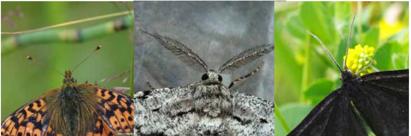
Myrpärlemofjäril (till vänster) är en dagfjäril och har en klubblik antenn. Nattfjärilar kan ha andra former på antenner, tex fjäderlik som björkmätaren (mitten) eller trådlika som sotmätaren (bild till höger).

Fjärilar använder sina antenner som luktorgan. De kan uppfatta hemliga dofter av andra fjärilar som vi inte kan känna (feromoner). Det är framförallt hanarna som använder sitt doftsinne för att lukta sig till honor av sin egen art som de kanske kan få para sig med.