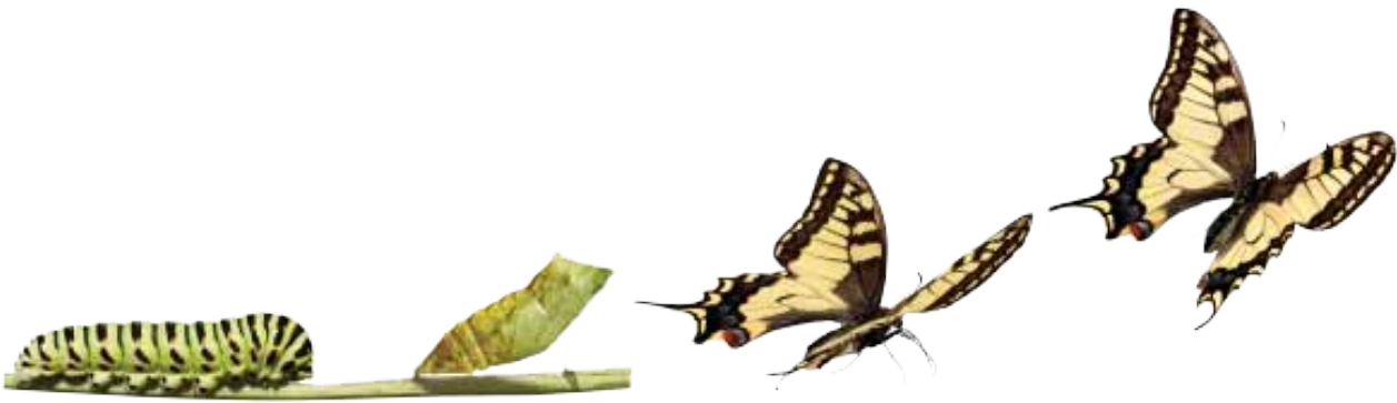
Makaonfjärilens larv, puppa och vuxna fjärilar (imago stadie).

Det tar olika lång tid för olika fjärilar att fullborda sin livscykel, dvs att gå från ägg till färdig insekt. Vissa svenska fjärilar hinner bara med en generation per år, och andra hinner med två. Eftersom de vuxna fjärilarna oftast bara lever några veckor så finns vissa fjärilsarter bara som flygande insekter under ett par veckor varje sommar. Andra som har flera, överlappande generationer upplever man som att de finns under en längre period på sommaren. Den fjäril som blir äldst är citronfjärilar som föds på hösten och övervintrar som vuxen insekt. De kan bli nästan ett år gamla.