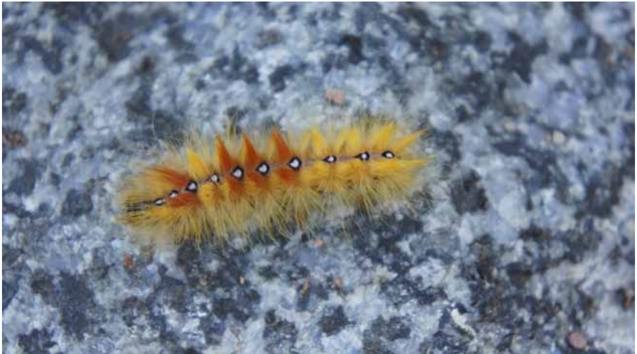
Larv av lönnaftonfly. Fjärilslarver är ofta skyddade av vassa taggar, utskott eller varningsfärger. Om man hittar en sån här larv kan det vara en bra ide att inte ta upp larven med händerna. Då kan taggarna lossna och fastna i fingret!

Ofta har de flygande fjärilarna andra krav på växter. De kan förflytta sig längre än larverna och de kan därmed ge sig ut för att födosöka på en annan plats. De vuxna fjärilarna äter inte så mycket utan tankar nektar från blommor. De suger upp nektar med sin långa ihoprullade snabel.